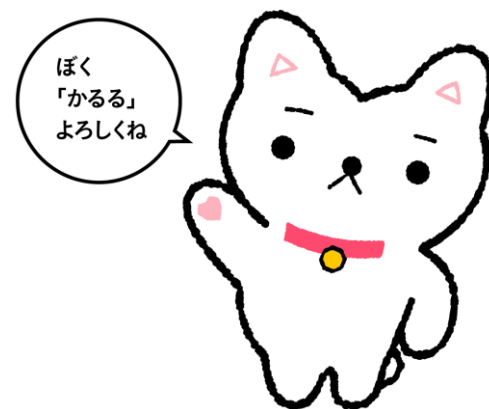
【「カルテコ」公式キャラクター 神田かるる】